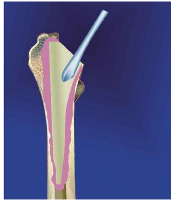
2. Удаление остатков цемента и рубцовой соединительной ткани