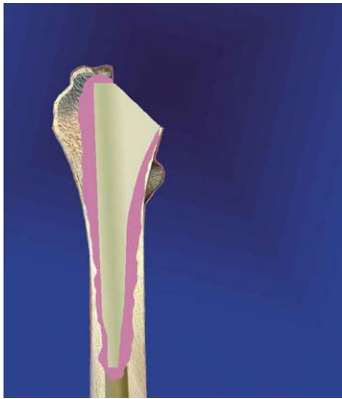
1. Удаление ножки эндопротеза