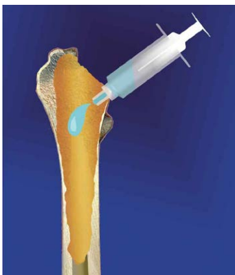
3. Туалет раны