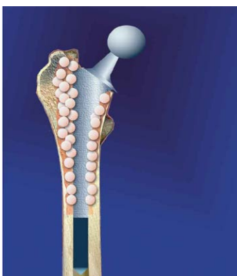
5. Заполнение дефекта гранулами КоллапАна