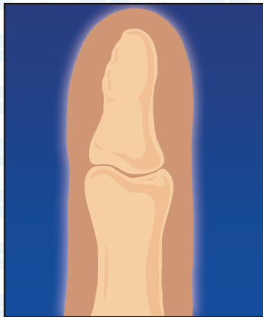
6. Результат: замещение КоллапАна костной тканью (4-6 мес.)