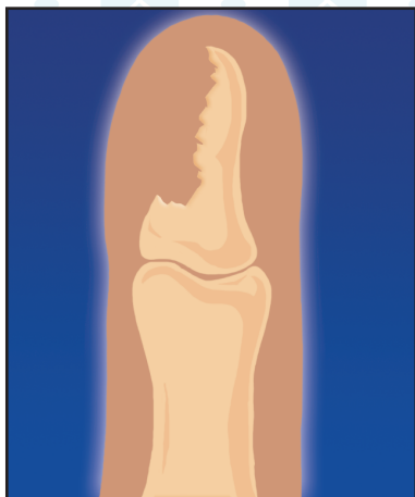
1. Деструкция кости фаланги