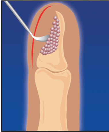
4. Заполнение костного дефекта гранулами КоллапАна