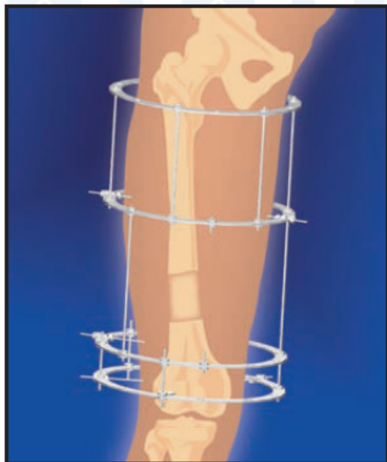
1. Удлинение бедра с замедленным формированием дистракционного регенерата