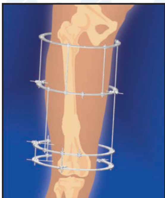
3. Стимуляция остеогенеза и перестройка КоллапАна