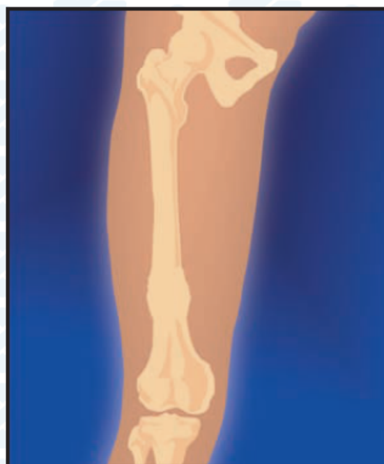
4. Результат: перестройка дистракционного регенерата в костную ткань

Методические рекомендации составлены д.м.н. проф. А.А. Очкуренко