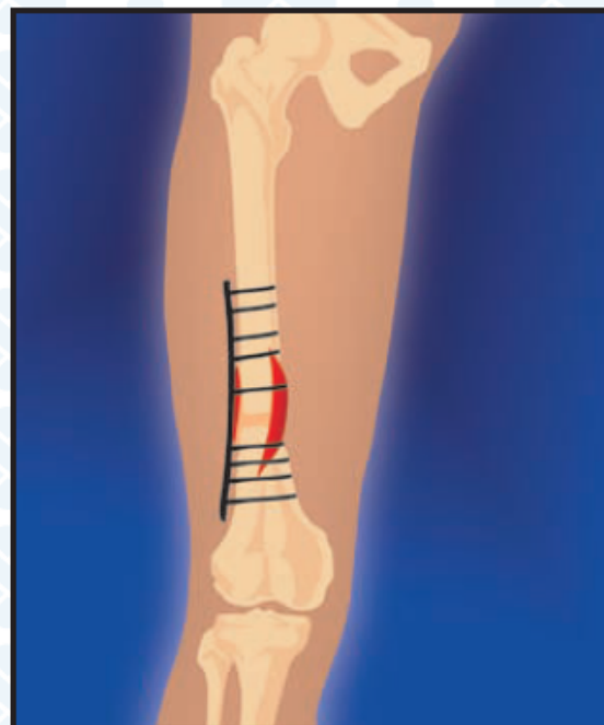
4. Остеосинтез костных фрагментов