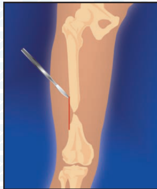
2. Послойный разрез мягких тканей. Доступ к ложному суставу