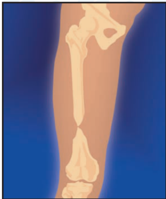
1. Ложный сустав кости