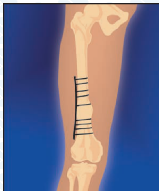
6. Результат: стимуляция остеогенеза и ликвидация ложного сустава (4-8 месяцев)