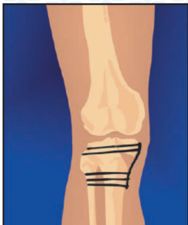
3. Открытая репозиция, фиксация пластиной