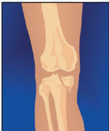
1. Перелом внутреннего мыщелка большеберцовой кости со смещением