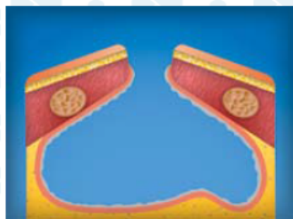
1. 1-я неделя лечения (экссудативная фаза). Санация полости мазями с антибиотиками