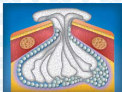
4. Гранулы КоллапАна плотно прижимают марлевыми тампонами, которые фиксируют марлевой повязкой