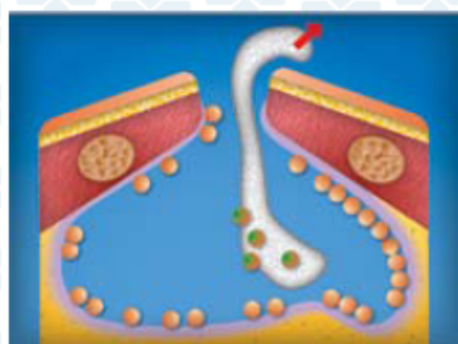
5. При перевязках производят замену свободнележащих нефиксированных гранул