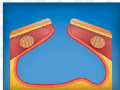
2. Начало продуктивной фазы воспаления (7-14-ые сутки). Полость эмпиемы промывают антисептиками, удаляют некротические массы