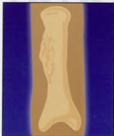
1. Опухоль фаланги