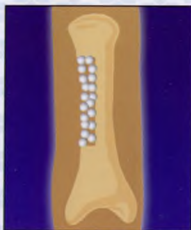
3. Пластика КоллапАном до внутреннего края кортикальной пластинки