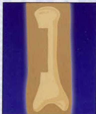
2. Краевая резекция, удаление опухоли