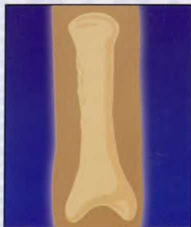
5. Результат оперативного лечения

Методические рекомендации составлены к.м.н. Макуниным В.И.