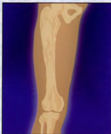
7. Результат: ликвидация остаточных полостей, предупреждение нагноения и восстановление костной ткани (10-18 месяцев)