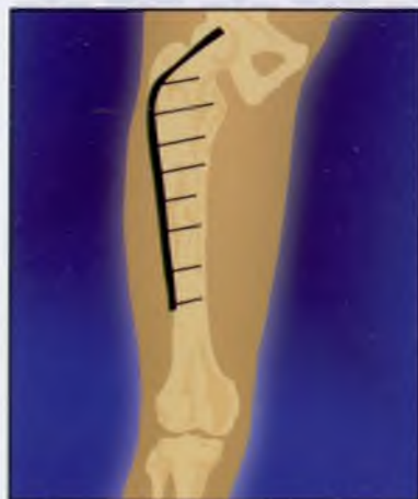
7. Результат: ликвидация остаточных полостей, предупреждение нагноения и восстановление костной ткани (10-18 месяцев)

Методические рекомендации составлены д.м.н., проф. А.А. Очкуренко.