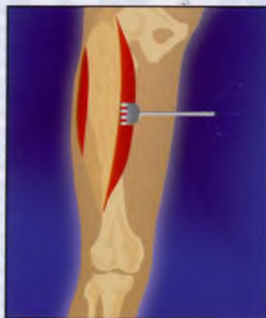
2. Доступ к патологическому очагу