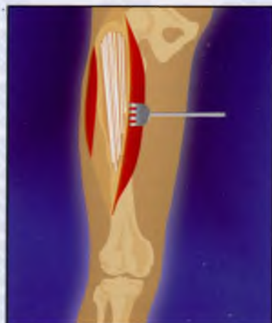
4. Аллопластика «вязанкой хвоста»