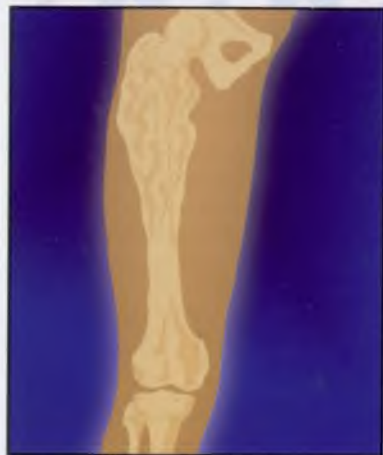
1. Массивное поражение костной ткани