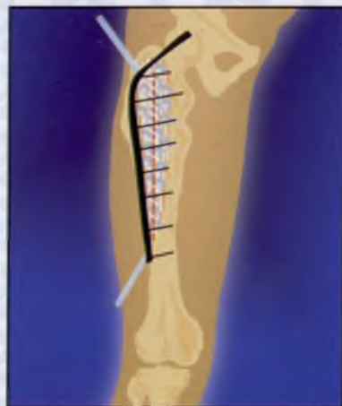
6. Дренирование и ушивание послеоперационной раны