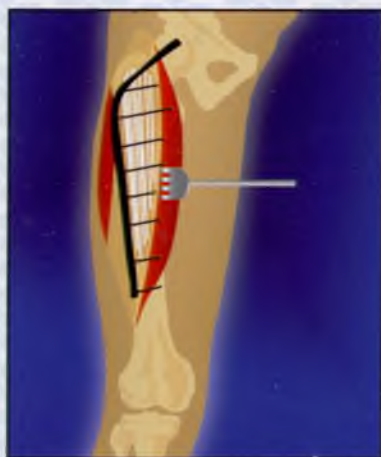
4. Аллопластика «вязанкой хвоста» и накостный металлоостеосинтез