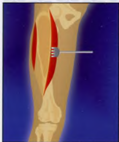
3. Обширная краевая резекция пораженной кости