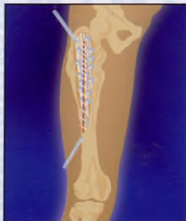
6. Дренажирование и ушивание послеоперационной раны